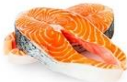
Морская рыба (лосось, сельдь)